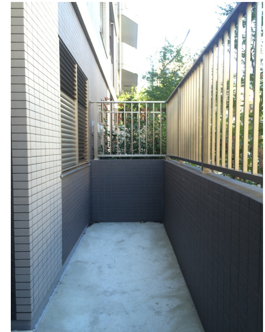
図面と現況が異なる場合は、現況を優先いたします。